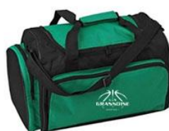
Sac de sport