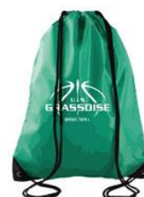
Petit sac à dos